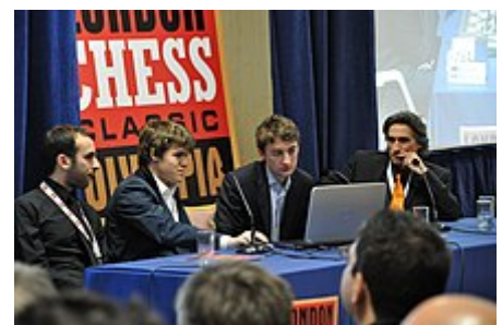
Assieme al Grande Maestro britannico Luke McShane durante un'analisi post partita del London Chess Classic 2010