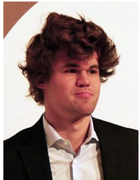
Carlsen nel 2017 durante il Torneo di Baden-Baden