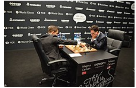
Assieme a Fabiano Caruana durante un momento della nona partita del Mondiale 2018