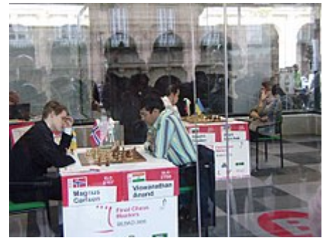
Carlsen affronta Anand durante l'edizione 2008 del Torneo di Bilbao. Sullo sfondo Veselin Topalov e Vasyl' Ivančuk