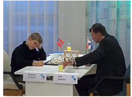
Magnus Carlsen affronta nel 2004 Ivan Sokolov durante l'ottava edizione del Torneo di Essent