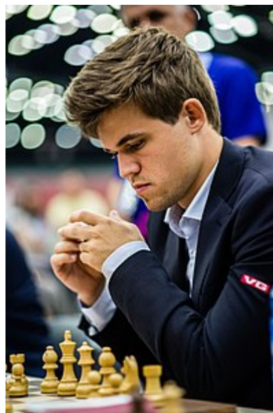
Magnus Carlsen (2016)