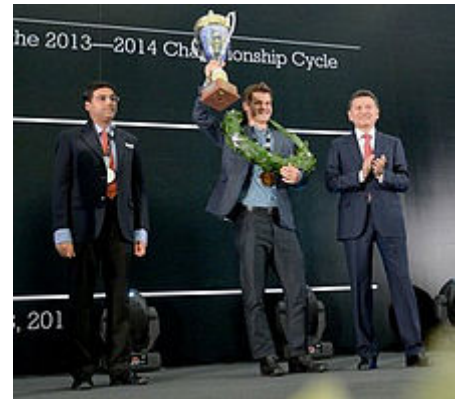
Un momento della Premiazione del Mondiale 2014. Assieme allo sfidante Anand, l'allora Presidente FIDE Kirsan Iljumžinov