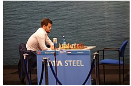
Durante un momento dell'edizione 2020 del Torneo Tata di Wijk aan Zee