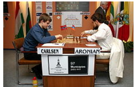
Carlsen–Aronyan, Linares 2007